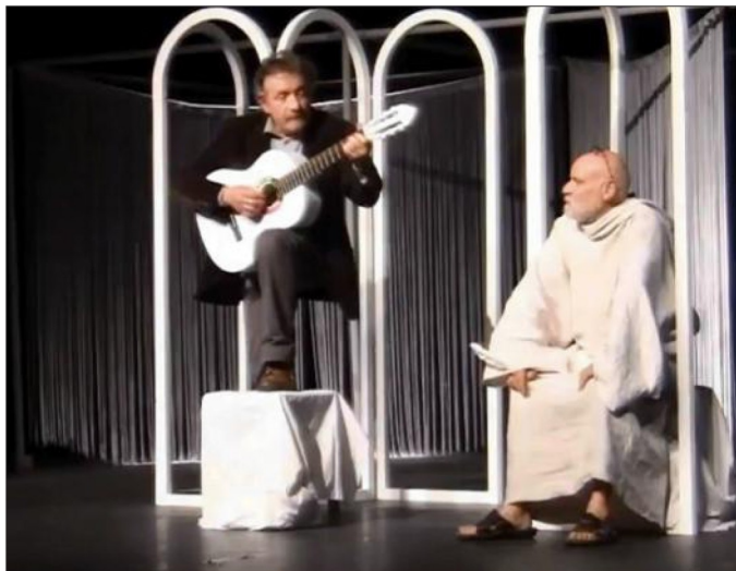
Georges Brassens arrive au paradis des poètes, accueilli par Saint Pierre.

Synopsis de la pièce : 29 octobre 1981, Brassens casse sa pipe. Il arrive au paradis des poètes et de la chanson. Saint-Pierre qui lui a préparé son dossier d'enregistrement l'attend. Pro-