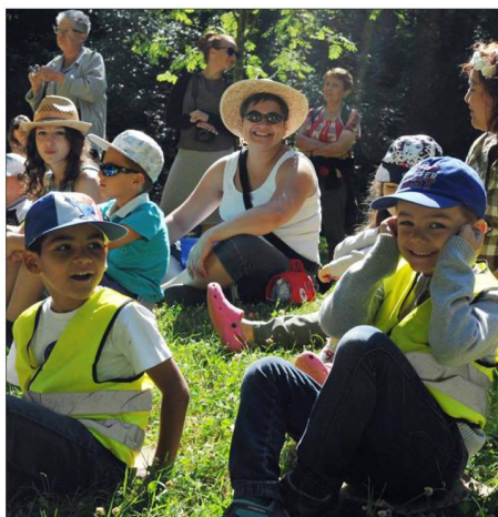
Vendredi matin, les enfants du centre aéré d'Algrange ont fait la connaissance du Grand Pio.