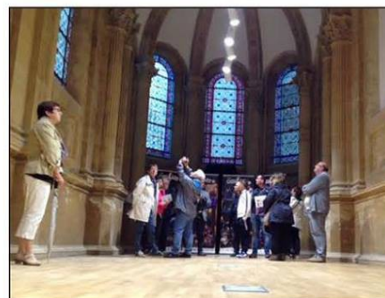
La chapelle Sainte-Trinité, construite en 1870 pour la famille De Wendel, peut accueillir quarante-neuf personnes maximum. Elle offre une acoustique et un cadre privilégié pour des concerts intimistes. En revanche, elle n'est que rarement utilisée par les services de la CAVF.