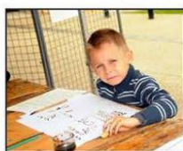
L'association Le semeur d'images proposait un atelier calligraphie.