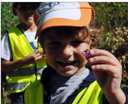
Mais qu'est-ce que c'est que ça ? Dans un coffre verrouillé trouvé sur le chemin, une multitude de petits cailloux brillants...

Une balade, un spectacle... Mais pas que. Val de Fensch Tourisme, en lien avec la compagnie Les Uns, Les Unes, revisite les rives de la Fensch à sa façon. En mêlant patrimoine de la Vallée et histoires cocasses pour un moment très inspirant avec le Grand Pio.