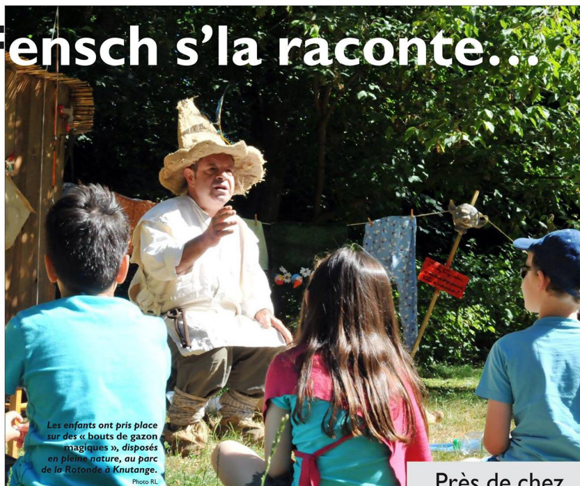
Les enfants ont pris place sur des « bouts de gazon magiques », disposés en pleine nature, au parc de la Rotonde à Knutange.