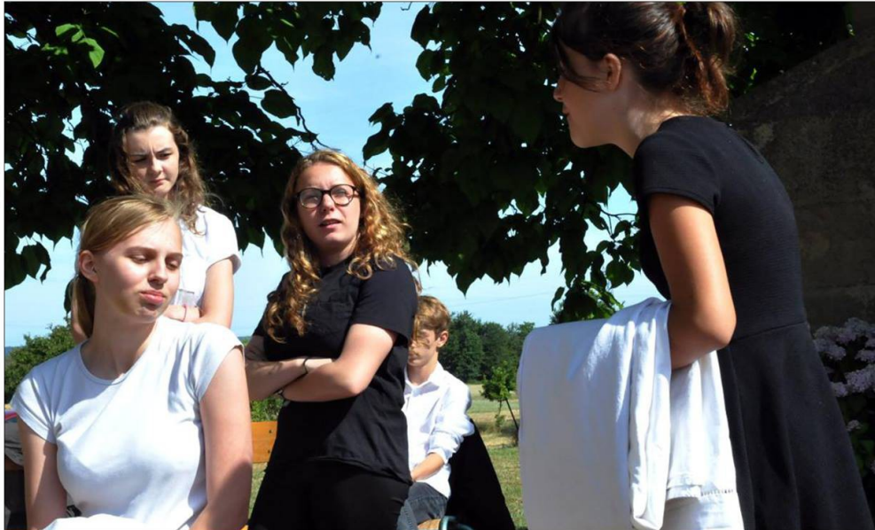
Le spectacle Cité en scènes est soutenu depuis huit ans par la Région, le Département et surtout la Communauté d'agglomération du Val de Fensch.

La compagnie Les Uns, les unes est épaulée par les jeunes comédiens de la Cité sociale de Fameck pour présenter son spectacle Cité en scènes. Prochaine représentation : le 23 août, à Knutange.