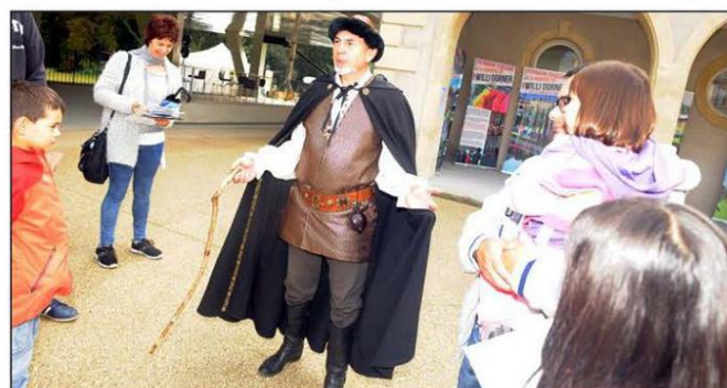
Pour les plus jeunes, la CAVF avait prévu des visites décalées sous la forme d'une enquête menée par l'inspecteur Laloupe.