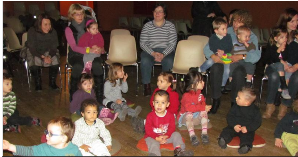
■ Les très jeunes spectateurs ont pris place autour de l'arène à graines.

La Compagnie « Héliotrope Théâtre » présente son spectacle « Légum'Sec » sur le territoire du Val de Lorraine du 5 décembre au 14 janvier. Les trois premières représentations se sont déroulées jeudi à Pompey devant un parterre de très jeunes bambins captivés. Le plaisir des mamans et des assistantes maternelles pré-