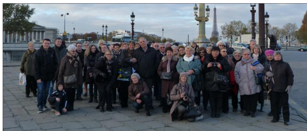
■ Les Gens du village débarquent sur le pavé parisien.

110 personnes ont pris place dans les bus affrétés par l'association des retraités et personnes âgées de Pompey et « Les gens du village ».