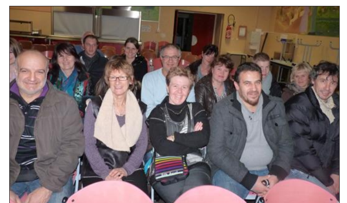
■ Un partage avec le public entièrement conquis.

Au théâtre, comme en cuisine, il suffit parfois de peu d'ingrédients pour faire une bonne recette, pourvu qu'ils soient de qualité. L'essentiel est de savoir bien les choisir, au bon moment, et de connaître l'art de les agencer entre eux. S'y ajoute la magie et le mystère de l'alchimie finale. Le succès d'une pièce est souvent une affaire de mariage réussi entre dif-